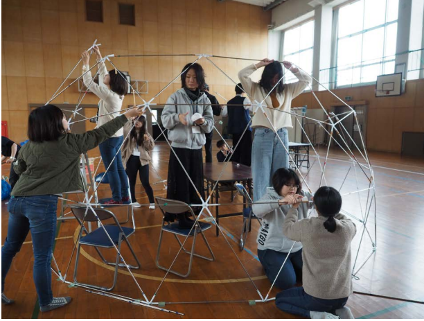
島の清掃・材料集めとワークショップの様子